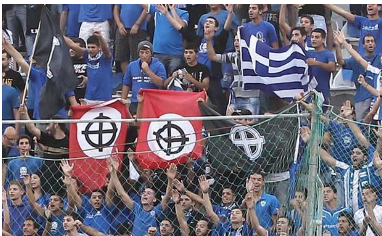
Οπαδοί σηκώνουν σημαίες με τον κέλτικο σταυρό, κλασσικό σύμβολο του νέο-φασισμού.